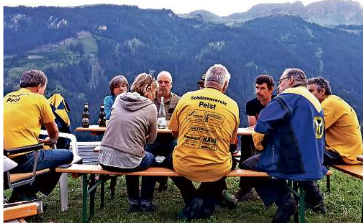
Gemütliches Zusammensein am Samstag nach dem Grümpelschiessen bei schöner Aussicht.

entwurf eine moderne, transparente gesetzliche Lösung für die Tourismusfinanzierung vorzulegen. Der Vorschlag nutzt den rechtlichen Spielraum, den das kantonale Recht bietet, aus und hält sich an folgende Zielsetzungen: Einfache und verständliche Tarife, Pauschalierungen, damit der erfolgreich arbeitende Behälter belohnt wird. Gleichzeitig wird der Vollzug vereinfacht und die Möglichkeit eingeschränkt, Abgaben nicht zu deklarieren.